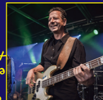
The simple man