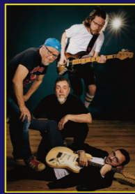
The Red Hot